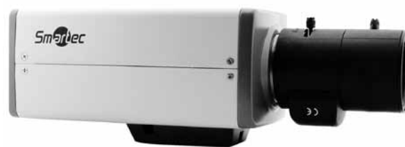
* Объектив в комплект поставки не входит

STC-IPM3077A поддерживает высокоэффективный видеокодек H.264 High Profile, который требует для передачи потока меньшую полосу пропускания. Благодаря H.264 HP камера может транслировать видео с высоким разрешением, высокой детализацией и параллельным аудиосопровождением. Так, видео, сформированное с использованием